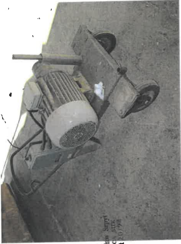
gr. inż. Zdzisław Szopył KZECZONA WCA SPTX Nr upr. 0120/19A